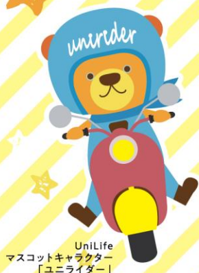
UniLife マスコットキャラクター 「ユニライダー」